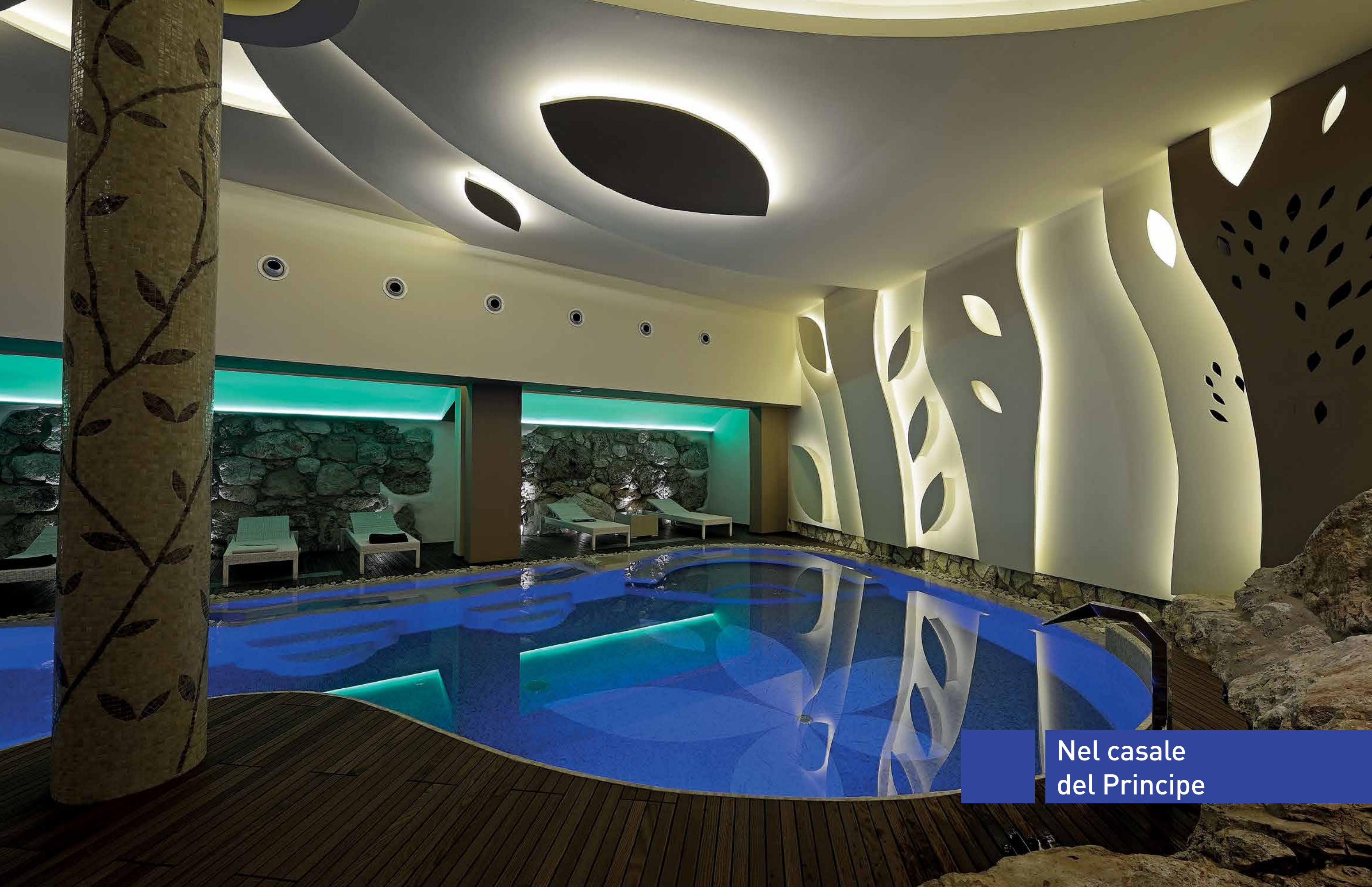
Nel casale del Principe